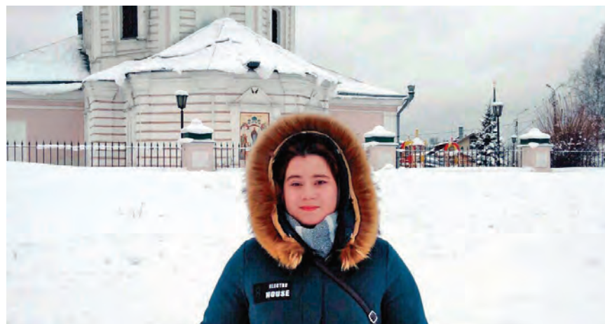
У Покровского собора в ландшафтном парке.

Так что будьте уверены, это далеко не последняя моя поездка в этот удивительный город!