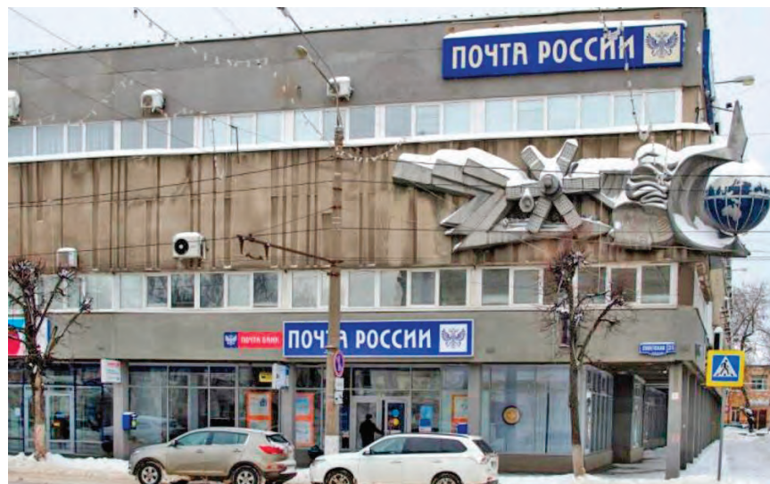
Вход строго по талончикам!