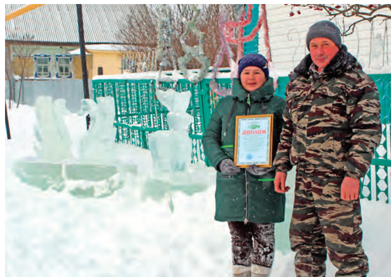
«Нужен мастер-класс по резьбе по льду? Обращайтесь!»

Ежегодно в нашем районе объявляется конкурс на лучшее оформление территорий сельских поселений. Многие сельчане украшают свои дома, территории школ и домов культуры задолго до новогодних праздников и объявления конкурса, создавая праздничное настроение себе и гостям.