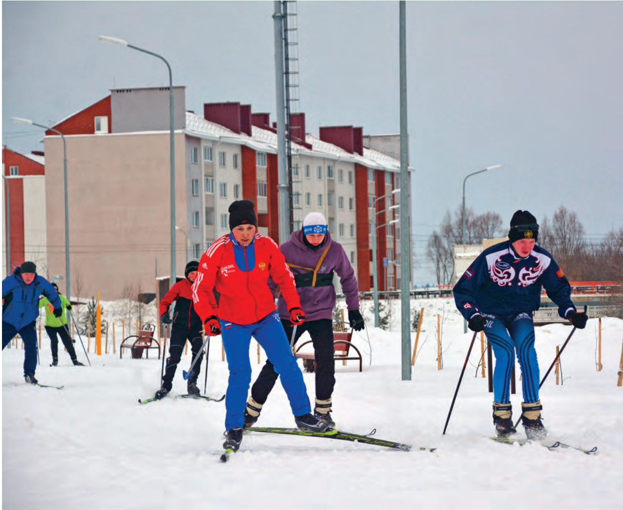
Места хватит и спортсменам, и просто отдыхающим.

Не пустует сквер и зимой. Для посетителей секций МАУ ФиС «Юность» проложило здесь лыжную трассу, которая периодически утаптывается снегоходом, содержится в надлежащем состоянии. Впрочем, проводятся здесь не только учебно-тренировочные занятия, приходят сюда жители и просто совершить лыжную или пешую прогулку, занимаются и любители скандинавской ходьбы.